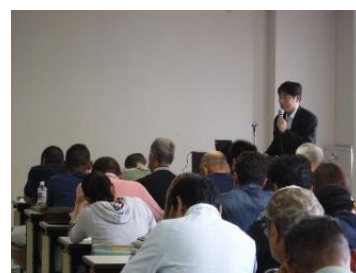
事業説明会及び講習会の様子