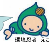
環境忍者 えこ之助