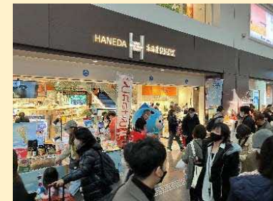
北海道いしかりフェア (どさんこプラザ羽田空港店)