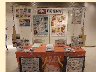
北海道mini移住・交流フェア （東京シティアイ）