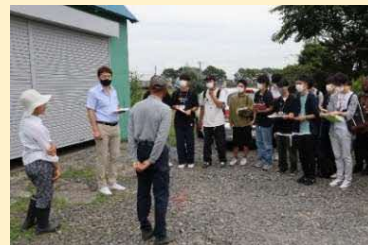
大学生の地域活動のようす （北海学園大学）