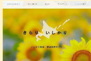
きらり☆いしかり・ポータルサイト