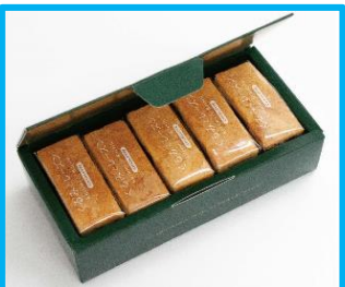
【くるみとレーズン】