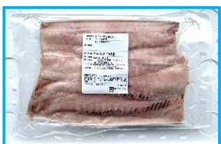
【ニシンフィレ6枚パック】