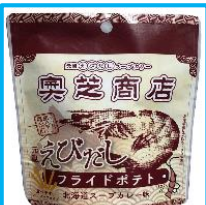
【奥芝商店えびだしスープカレー味フライドポテト】