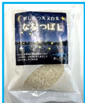
【しんしのつ天文台米】