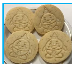
【おこめちゃんクッキー】