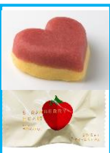
【ストロベリーショート】