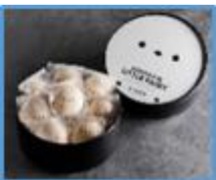
【ほめぐるシマエナガ】