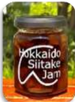
しいたけジャム(江別市)