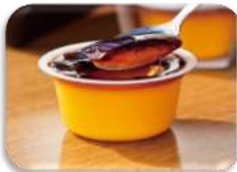
かぼちゃプリン (恵庭市)