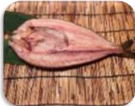
冷風熟成干し開ホッケ特大 (札幌市)

いしかりフェアでは、都市近郊で採れた鮮度の高い農産物や、石狩管内の食関連企業が製造した加工品・飲料を販売するほか、振興局や市町村による観光PRを行います。