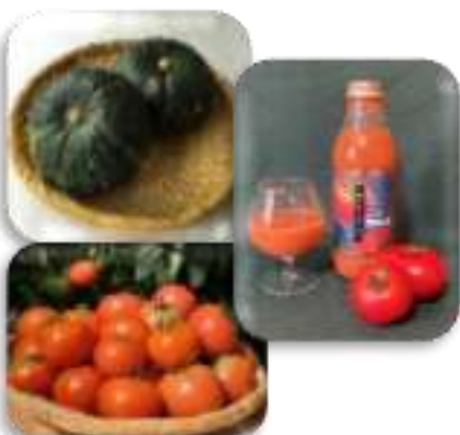
野菜、トマトジュース (当別町)