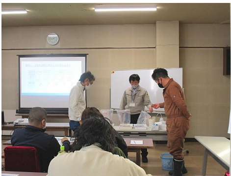
土づくり基礎編 ～実際に土を触ることが大切～