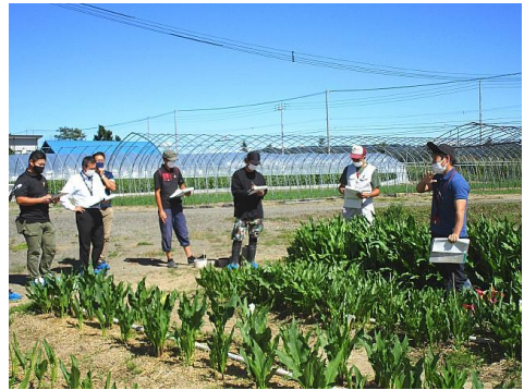
花き基礎編 ～ベテラン生産者に栽培を聞く～