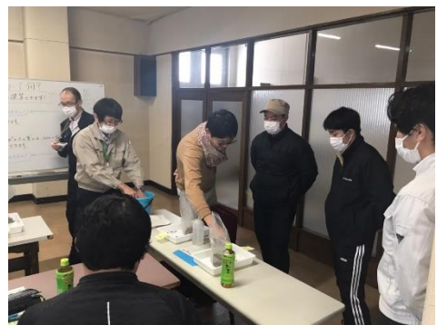
土づくり基礎編 ～前年同様、基礎からしっかり～