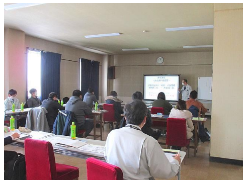
経営基礎編 ～いくら稼ぎたいか？から考える～