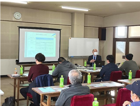
経営応用編 ～法人化、経営継承を学ぶ～