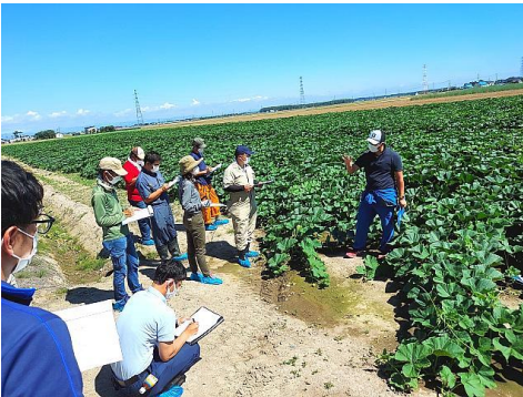
かぼちゃ基礎編 ～受講者が自らの栽培を紹介～