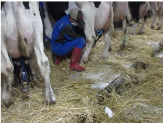
◆搾乳手順を見直し、衛生的な搾乳が実践された（D農場）。