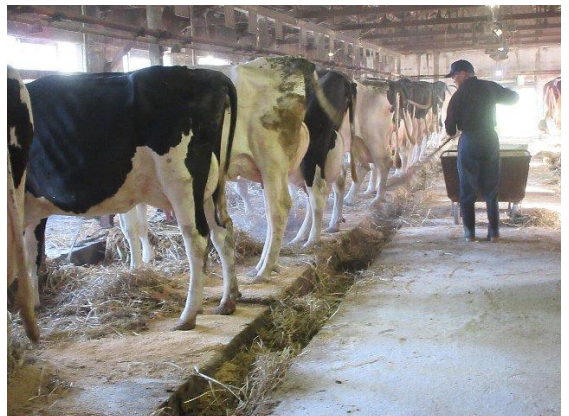
◆牛床に敷料を多く投入し、牛体がきれいに保たれるようになった（D農場）。