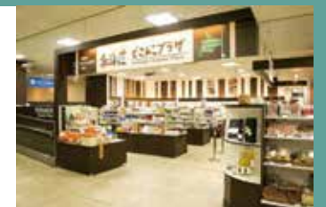
▲北海道どさんこプラザ札幌店

北海道が国内外に設置する公式アンテナショップ「北海道どさんこプラザ」では、道内各地の特産品・加工品が販売されています。北海道を代表する人気商品だけでなく、テスト販売として、まだまだお目にかかれない新商品も置かれています。近くにお越しの際は、ぜひお立ち寄りください。