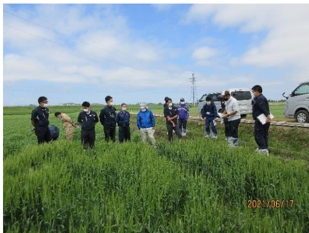
写真1 種子審査に係るほ場目合わせ