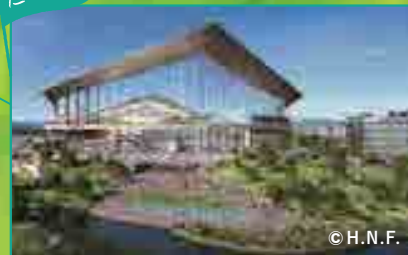
北広島市 / 北海道ボールパークFビレッジ 北海道日本ハムファイターズの拠点球場を中心に多彩なアクティビティを楽しめる複合施設。(2023年開業予定)