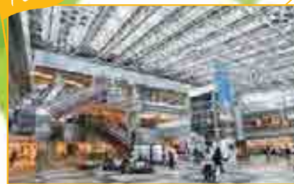
千歳市 / 新千歳空港 国内外と北海道を結ぶ空の玄関口。近年はグルメやショッピングスポットとしても人気。