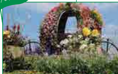
恵庭市 / 道と川の駅 花ロードえにわ 「花・水・緑・田園」をテーマにした道の駅。コンサバトリー（人に優しい温室）がシンボル。