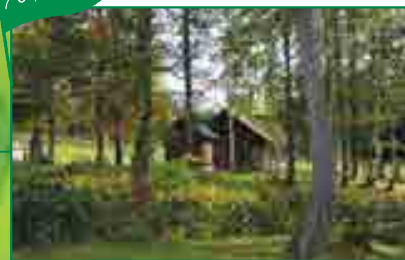
当別町 / 道民の森 北海道が整備した国内最大級の森林総合利用施設。キャンプスポットとして人気。