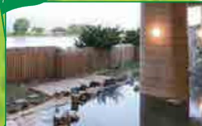
新篠津村 / たつぷの湯 しのつ湖のそばにある天然温泉。湖ではグランピングやワカサギ釣りが楽しめる。