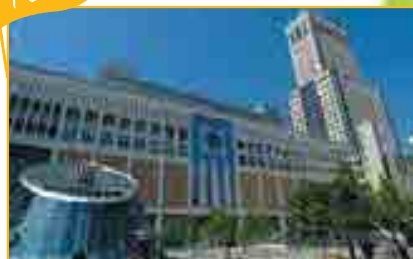
札幌市 / 札幌駅 (JRタワー) ホテルやデパート、ファッションビルなどからなる札幌を代表するショッピング街。