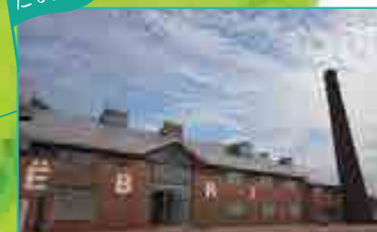
江別市 / EBRI 食とイベント、マルシェをコンセプトにした商業施設。地元の農産物を生かした催しを企画。