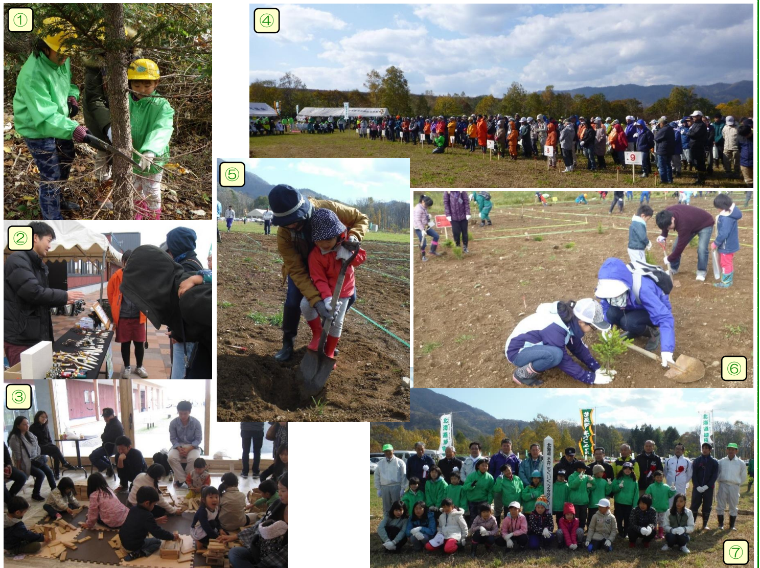
①…枝打ち作業(育樹祭)、②③…道の駅 催事会場、④…植樹祭に参加された多くの方々、⑤⑥…植樹作業、⑦…来賓・ながぬま緑の少年団・当別町の子供達による記念撮影

希望者を対象に行った「森林散策」では、「道民の森ボランティア協会」の会員の方々による森の案内や詳しい説明のもと、「道民の森」の散策路を約1時間の行程で散策し、樹齢470年のミズナラの巨木を見学するなど、多くの子供達も参加して、行われました。紅葉のきれいな秋の休日、参加者1人1人が思い思いに、さまざまな形で「木育」に取り組んだ有意義な1日でした。