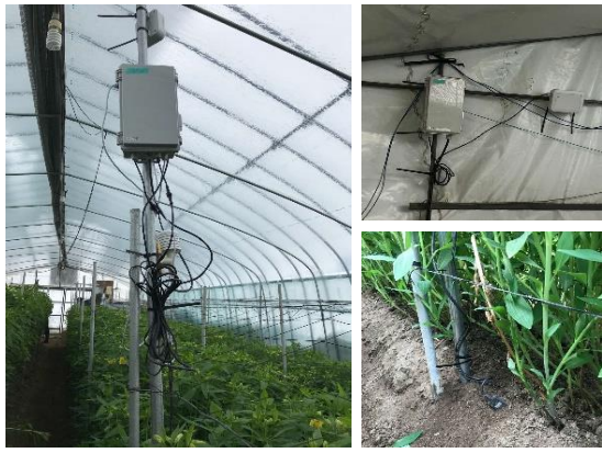
設置したモニタリング機器