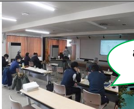
写真：GAP研修会のような研修会には、経営者以外の 家族も 出席