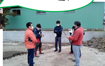
写真：関係期間と現地指導