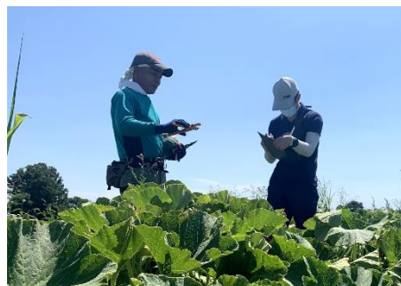
現地実証試験の実施