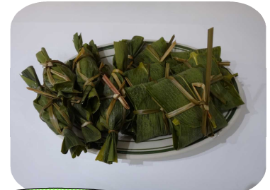
地域の味「笹だんご」