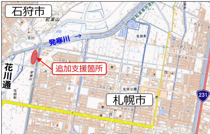
※地理院地図に加筆