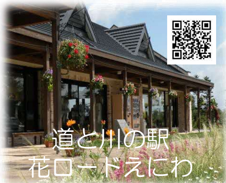
道と川の駅 花ロードえにわ