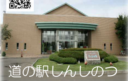
道の駅しんしのつ