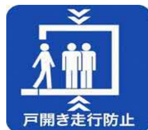
戸開走行保護装置設置済みマーク

本制度に関する詳細については、以下にお問合せください。 一般社団法人建築性能基準推進協会 電話：03-3513-7561 WEB： https://www.seinokyo.jp/