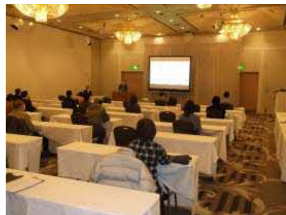
千歳勉強会の様子