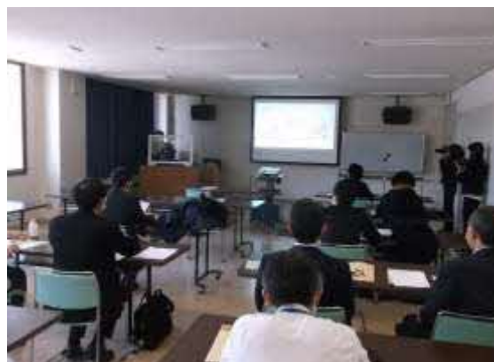
恵庭勉強会の様子