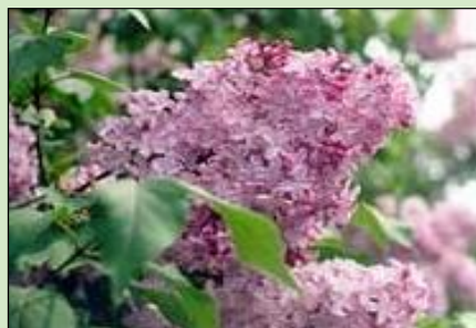
市の木 ライラック