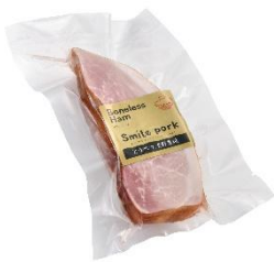
有限会社浅野農場 スマイルモモハム (北のハイグレード食品 2025)

石狩管内は観光入込客数（延べ人数）が全道の約2割、外国人宿泊客数が全道の約4割を占める等、札幌市を中心に、道内において多くの観光客が訪れる地域です。令和6年度の観光入込客数は約3,031万人と前年度と比較して5.9%の増加、外国人宿泊客数においては36.5%と大幅に増加しました。