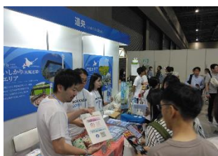
ツーリズム EXPO ジャパン観光 PR (愛知県)