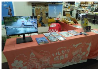
いしかりフェア観光 PR (札幌市)