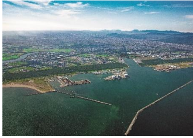
石狩湾新港工業団地（石狩市）

石狩管内は、製造業の工場等事業所の立地が進んでいる地域であり、2024年経済構造実態調査によると、令和6年6月1日現在で、管内の事業所数は全道の28.5%、従業員数は32.2%を占めています。製造品出荷額等は全道の22.1%を占めており、対前年比は6.1%増加となっています。