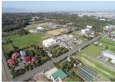
江別 RTN パーク（江別市）