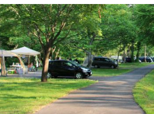
一番川地区 オートキャンプ場