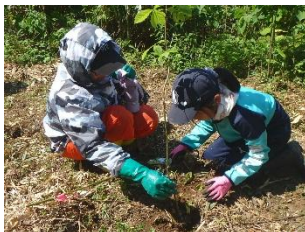
小学校植樹活動（石狩市）

また、道が推進する、子どもをはじめとするすべての人が「木とふれあい、木に学び、木と生きる」取組の「木育」について、管内では、教育・保育機関による森林づくり活動や木育マイスターをはじめ、企業や団体など多様な主体が連携した普及啓発イベントなどの取組が広がっています。