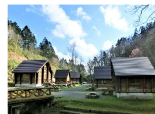
月形地区 バンガロー