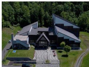
神居尻地区 森林学習センター