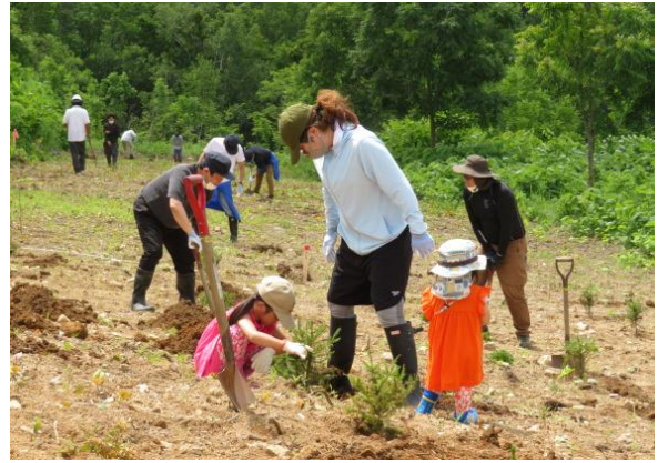
「道民の森・神居尻地区」での植樹活動(当別町)

多くの道民が参加し植樹を行う「北海道植樹祭」を水源の森でこれまで5回開催、延べ2,610人の方が参加し、4.11haの区画に7,600本の苗木が植樹されています。