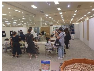
木育ワークショップ（札幌市）