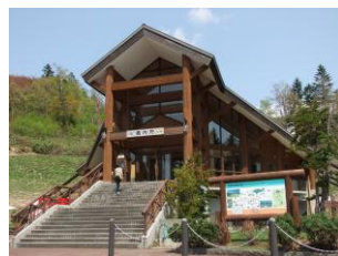
神居尻地区 総合案内所

道民の森は、石狩管内当別町と空知管内月形町にまたがる道有地約 12,000ha を活用した森林総合利用施設です。道民が森林とのふれあいを通じて自然とともに生きる力を培う場として、6 地区の利用ゾーンが整備されています。