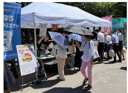
さっぽろぐるめぐりエイト(札幌市)