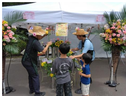
フラワーアレンジメント体験会(札幌市)