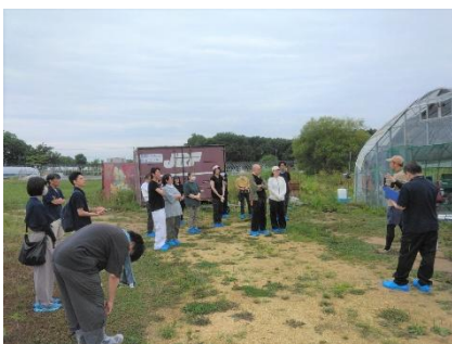
いしかり農業体験ツアー(石狩市)

管内産の花きのPRをするために、「さっぽろぐるめぐりエイト」の開催日に合わせて、管内産花きによるフラワースタンドの展示と、子供向けフラワーアレンジメント体験会を開催しました。