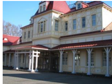
道立自然公園野幌森林公園内の北海道開拓の村（札幌市）