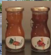
新篠津村 のっつ野菜 にんじんまるごとジュース まるごとトマトジュース