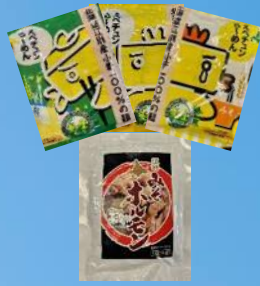
江別市 江別観光協会 江別みそホルモン えべちyunラーメン (しょうゆ・みそ・しお)