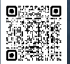
石狩の魅力発信 こちらをチェック