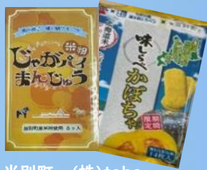
当別町 (株)tobe じゃがパイまんじゅう 味しらす かぼちゃ