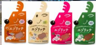
札幌市 (株)グラッド【8/2のみ出店】 なまらエゾリッチプレーン エゾリッチ (ピーズ・小松菜など)