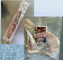
石狩市 (同)佐藤太郎 とば珍、ひれ珍