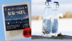
新篠津村 新篠津村観光協会 【8/3のみ出店】 しんしのつこめサイダー しんしのつ天文台米