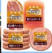
江別市 (株)トンデンファーム 炭焼きソーセージ【実演】 ソーセージ詰め合わせ