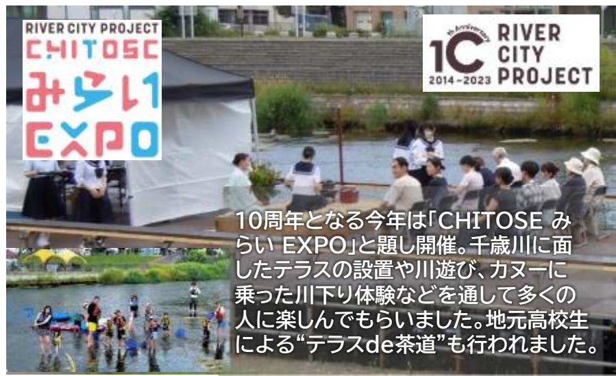
10周年となる今年は「CHITOSE みらい EXPO」と題し開催。千歳川に面したテラスの設置や川遊び、カヌーに乗った川下り体験などを通して多くの人に楽しんでもらいました。地元高校生による“テラスde茶道”も行われました。

具体的には、川に関する情報の効果的な発信、住民や観光客の水辺利用や周遊のサポート、各地域・分野の関係者間のネットワーク強化による水辺利活用に係るニーズの発掘・マッチングの促進、地域と連携した魅力的な水辺空間の創出等により、地域づくり・観光振興に貢献する取組を推進します。