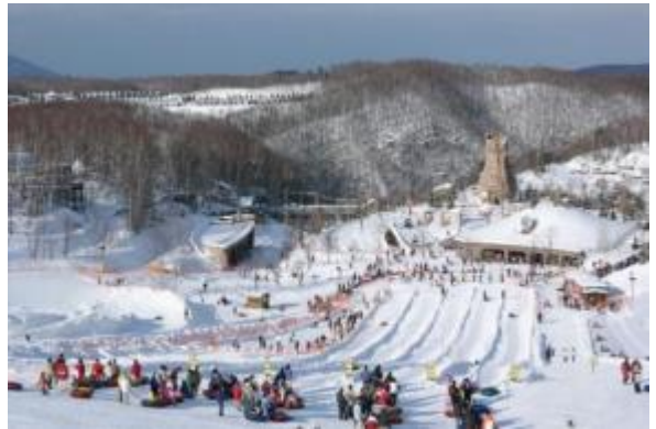
イングリッシュガイドツアー(スノーシュー冬季園内散策) ※写真は過年度のもの