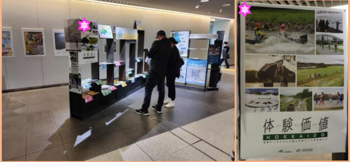
ウポポイの魅力 を情報発信