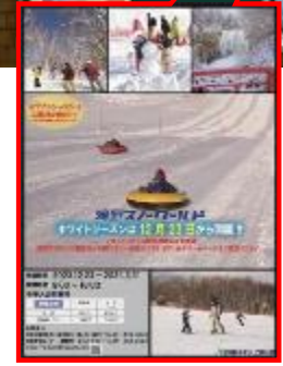
R5広告ポスター(札幌市営地下鉄構内に掲示)