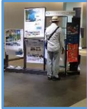
シーニックバイウェイや 秀逸な道の取組紹介