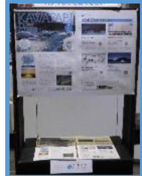
かわたびほっかいどう の魅力を情報発信

「北海道“みりよく”発信プロジェクト」を年4回開催。秋の“みりよく”発信では、アジア初となるアドベンチャートラベル・ワールドサミット北海道・日本が開催されることに併せて、道内各地における魅力的な アクティビティ・自然・異文化体験 について重点的に情報発信を行った。