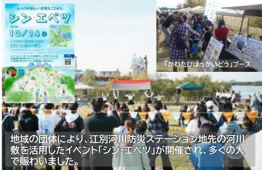
地域の団体により、江別河川防災ステーション地先の河川敷を活用したイベント「シン・エベツ」が開催され、多くの人で賑わいました。