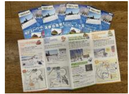
4カ国語によるHPおよびガイドブックの作成