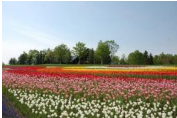
花フェスタ(花修景施設 カントリーガーデン)

「自然と人・人と人のふれあい」を基本テーマとし、多様なニーズに対応して四季を通じた利用促進を図るため、花フェスタ(チューリップ・すずらん等)、滝野スノーフェスティバル、森の中で音楽やソリ遊びを楽しむ森フェス等様々な野外レクリエーション活動を展開するとともに、快適・円滑に公園を楽しむための環境整備を推進しています。