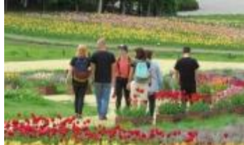
インバウンド観光客の花修景鑑賞(チューリップ・すずらんフェスタ) ※写真は過年度のもの