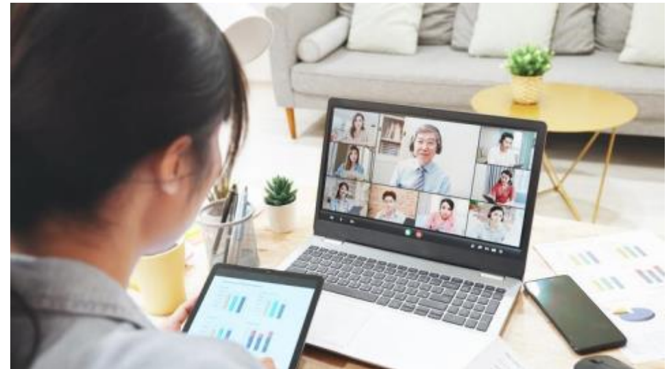
多様な暮らし方・働き方の実現