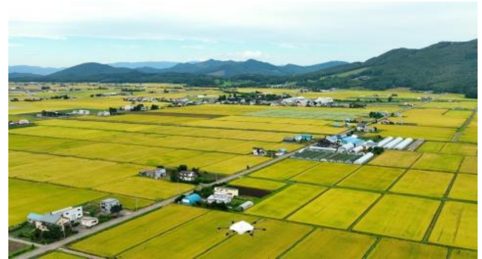
ドローン物流の社会実装等物流DXの推進