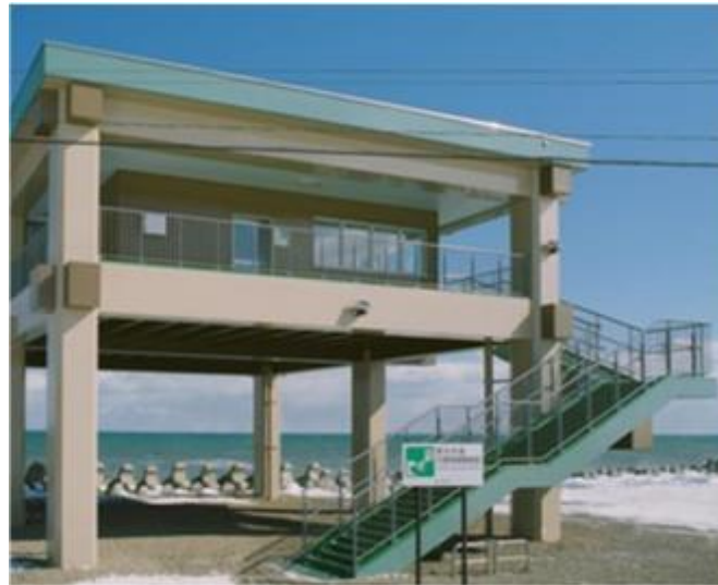
日本海溝・千島海溝周辺 海溝型地震への対応 (津波避難タワーの計画・建設)