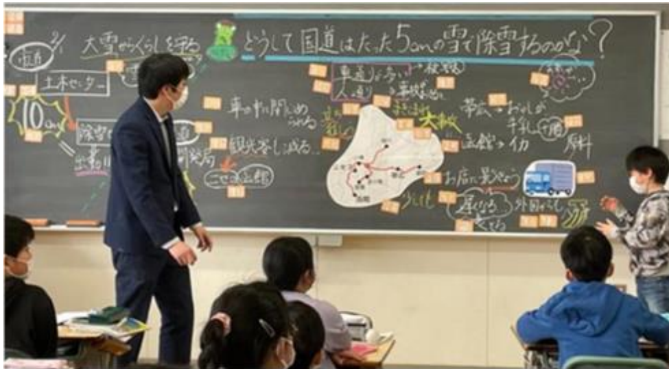
人への投資と多様な人材・主体による共創 (地域に貢献する若い世代の育成・認定NPO法人ほっかいどう学推進フォーラム提供)