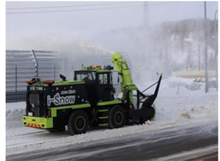
持続可能な除排雪等の推進 (ICT技術を活用した除雪作業の省力化(i-Snow))