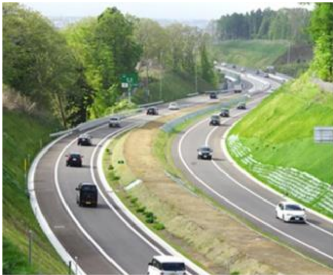
広域分散型社会を支える 交通ネットワークの形成 (函館新外環状道路空港道路(赤川IC～函館空港IC))