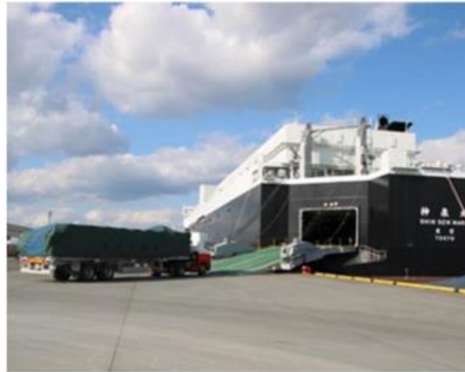
産業を支える物流システムの維持・効率化 (RORO船へのトラック積み込み状況:苫小牧西港)