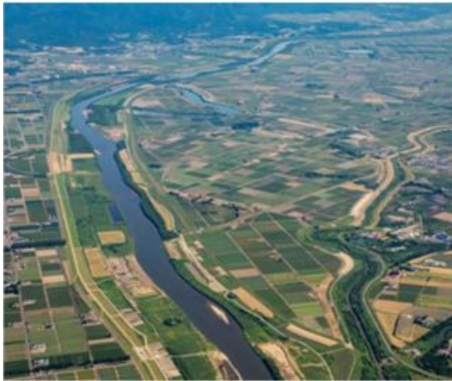
流域治水の推進 (石狩川と施工中の北村遊水地)