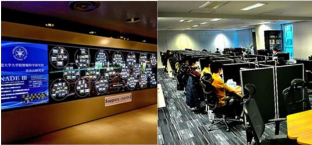
高等教育機関、行政機関、企業等における デジタル人材の育成・確保