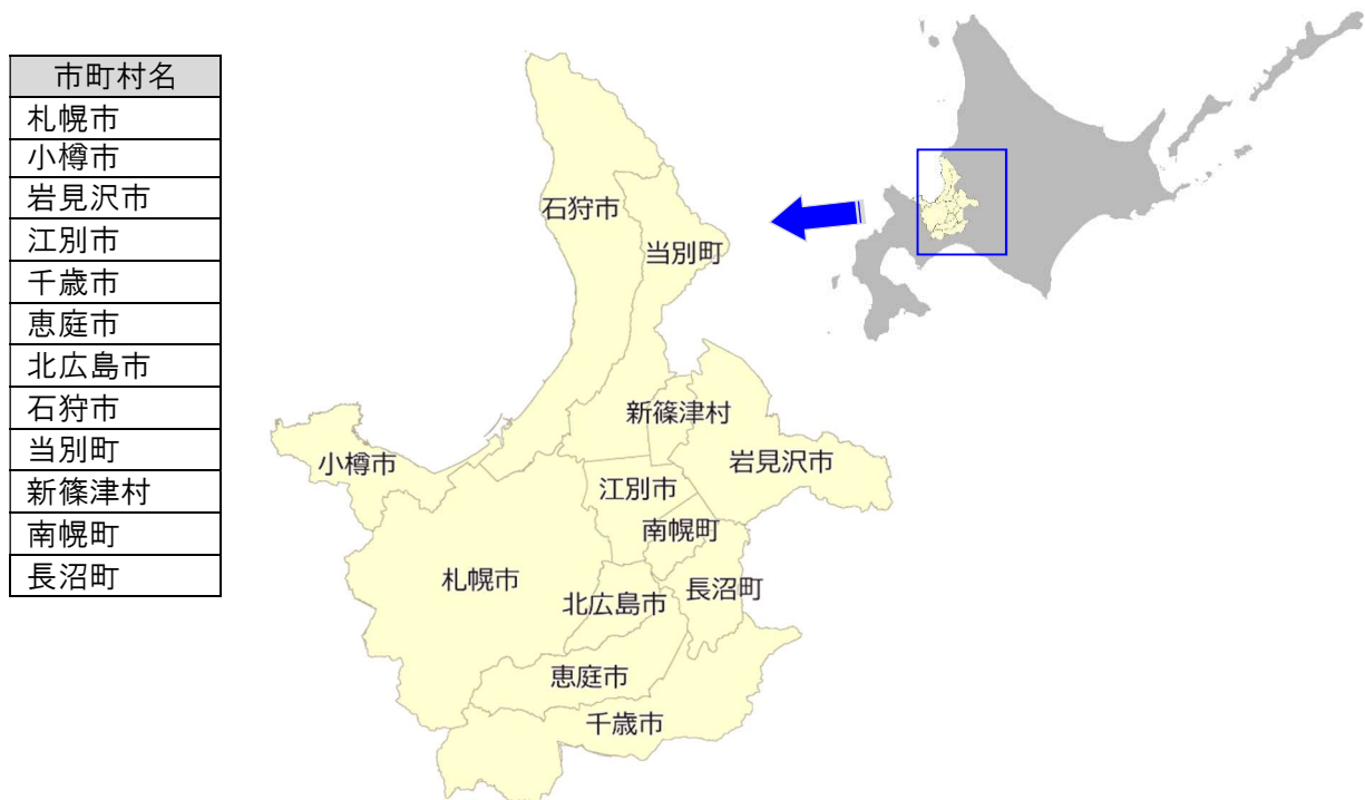
図 1-1 本計画の対象区域