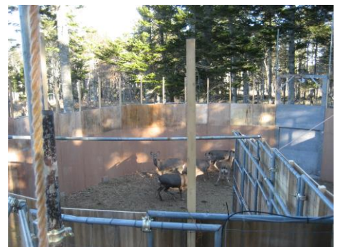
厚岸町内に設置した囲いワナ