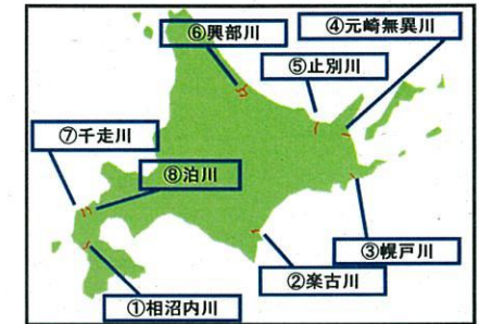
【禁止区域のイメージ図】