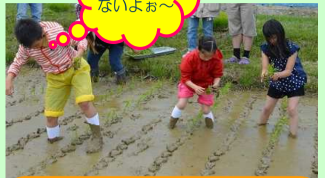
泥の中は、気持ちいいヨ！