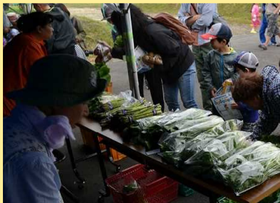
地元農産物は、新鮮！大人気！