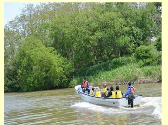
運河の旅へ！いざ、出発！