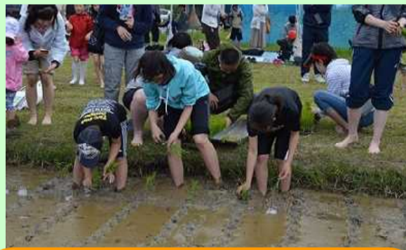
主催者のかけ声で、田んぼの中へ！