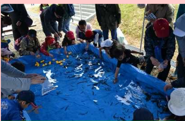
ドジョウは、すばやい！