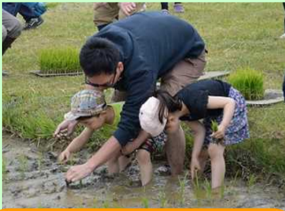
植えるコツが、わかってきたヨ！