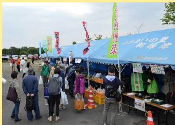
たちまち、長蛇の列に！