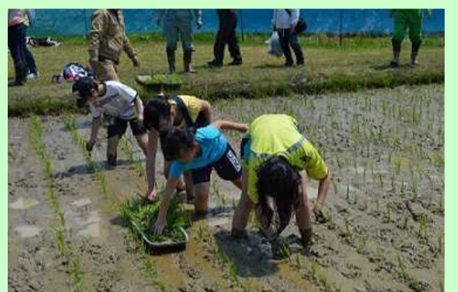
楽しい！たくさん、植えるゾ！