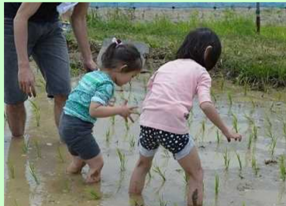
泥んこまみれで、奮闘！