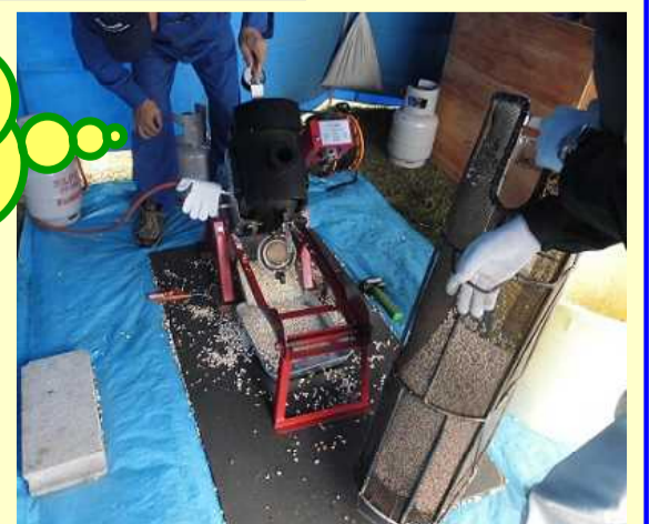
美味しい匂いに誘われ、長蛇の列に！