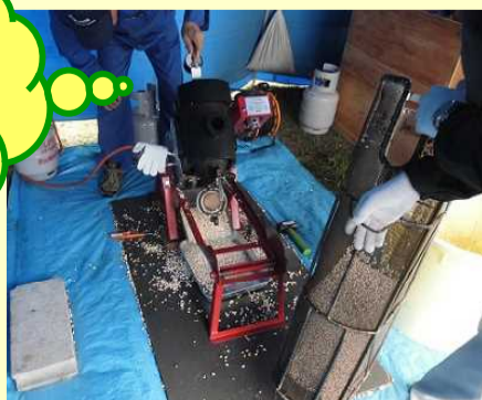
この機械で作る様子を見て、感動！