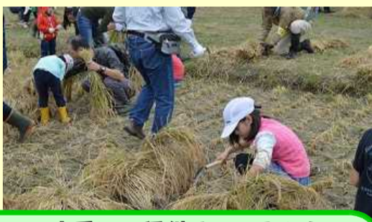
上手に、稲刈りできるよ！