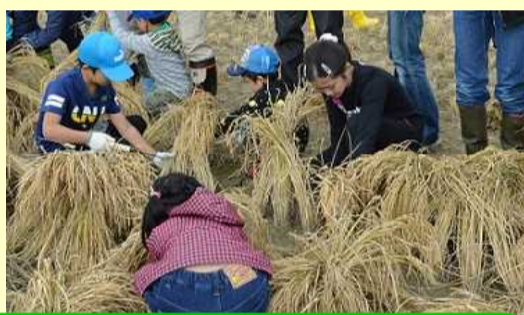
稲刈りは、初体験！楽しい！