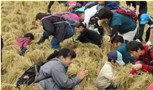
主催者の合図で、稲刈りスタート