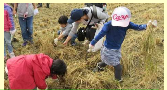
お米は、この稲からできるんだぁ！