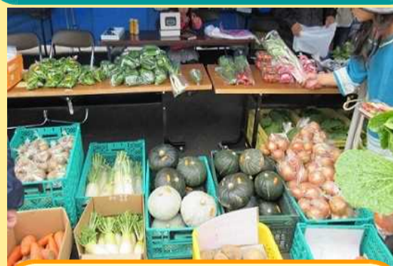
地元野菜は、新鮮で美味しそう！