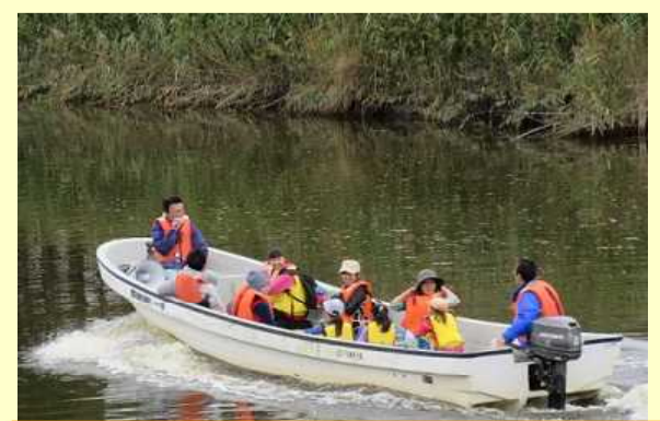
ライフジャケットを着用し、運河の旅へ！