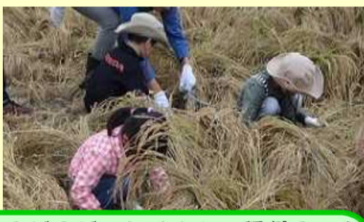
まだまだ、たくさん、稲刈るよ！