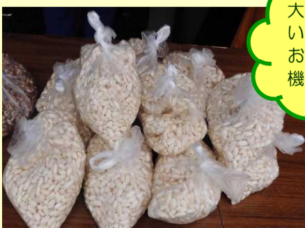
ポン菓子は、子供達に大人気！