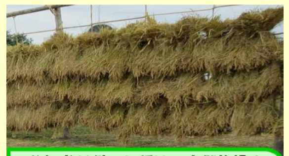
参加者が刈った稲は、自然乾燥！