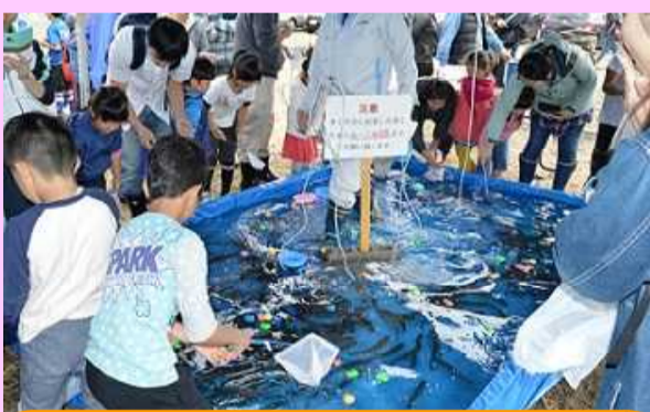
動きがすばやい！ニジマスたち！