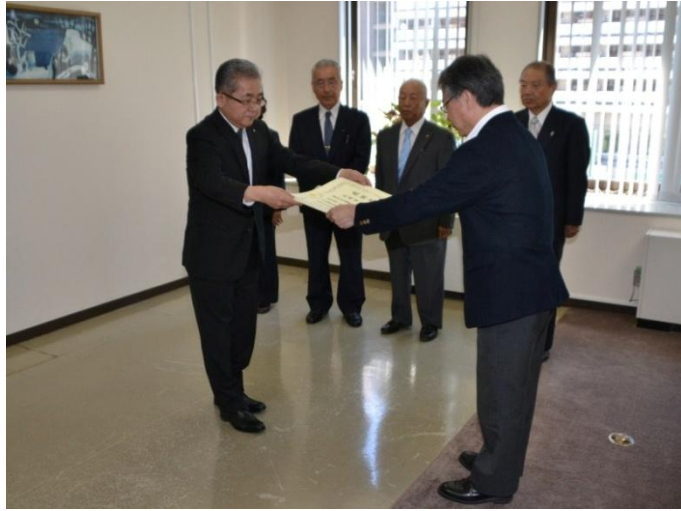
宮浦東区長（右）へ石狩振興局澁谷環境福祉長（左）から知事感謝状を贈呈

東区は、平成25年8月26日から交通事故死ゼロを継続しており、平成26年6月22日午前0時をもって300日となり、6月24日東区へ知事感謝状を贈呈しました。