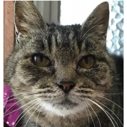
仮名：みはる おばちゃん(?)猫です

ちょっと目つきは鋭い感じ(!?)だけど、ぜんぜん♡人が大好きなの♡困ったところといえば、少し胃腸が弱いところ・・・車酔いで吐いてしまったり、環境の変化で吐いてしまったり下痢してしまったり・・・こんなわたしを迎えてくれる優しい飼い主さん、お待ちしております♪