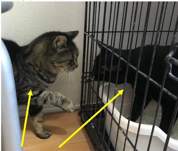
みはる ジジ (人慣れしていない黒猫の男の子です)