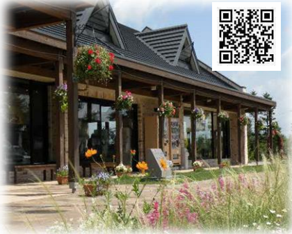
道と川の駅花ロードえにわ

※石狩管内の周遊観光の促進のため、特産品購入者に道の駅からプレゼントがあります。