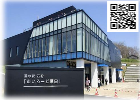
道の駅石狩あいろーど厚田