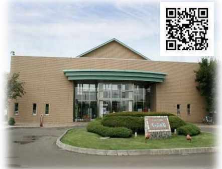
道の駅しんしのつ