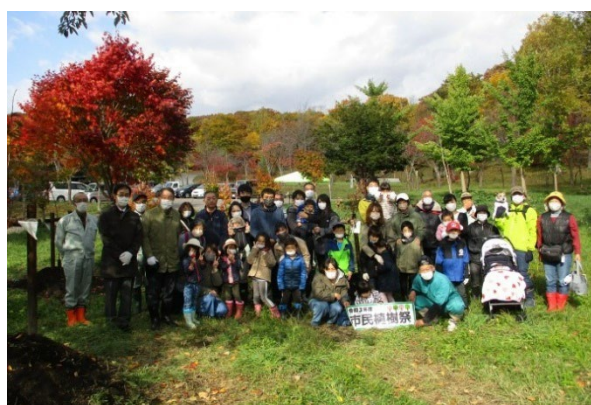
深川市を緑にする会主催の市民植樹祭