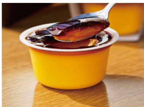
かぼちゃプリン (恵庭市)