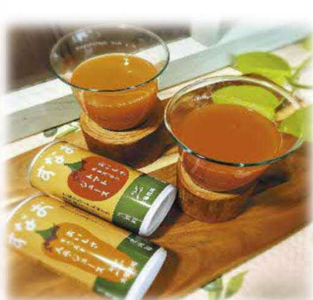
にんじんジュース・ トマトジュース(当別町)