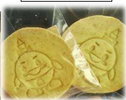
おこめちゃんクッキー (新篠津村)

いしかりフェアでは、都市近郊で採れた鮮度の高い農産物や、石狩管内の食関連企業が製造した加工品・飲料を販売するほか、振興局や市町村による観光PRを行います。来場の際、ソーシャルディスタンスの確保や手指消毒等へのご協力をお願いいたします。