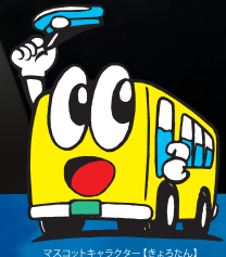
マスクキャラクター【きよたん】