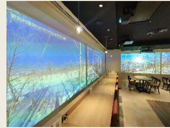
○ノースカフェ&BEER (uralaa park haneda 併設)