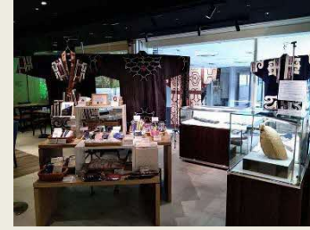
○観光パンフレット配架