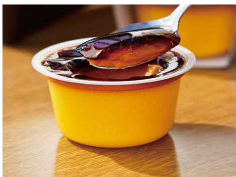
かぼちゃプリン (恵庭市)