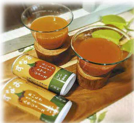
にんじんジュース・ トマトジュース(当別町)