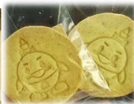
おこめちゃんクッキー (新篠津村)

いしかりフェアでは、都市近郊で採れた鮮度の高い農産物や、石狩管内の食関連企業が製造した加工品・飲料を販売するほか、振興局や市町村による観光PRを行います。来場の際、ソーシャルディスタンスの確保や手指消毒等へのご協力をお願いいたします。