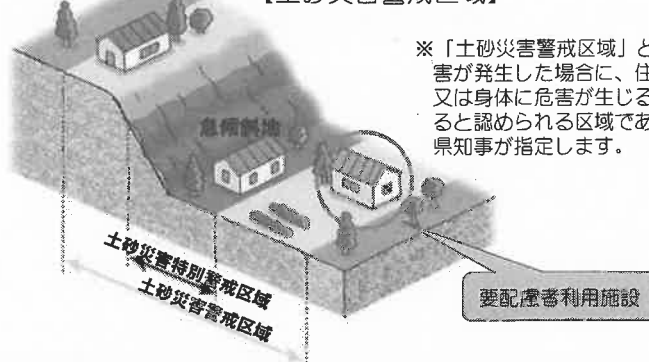
【土砂災害警戒区域】

※「土砂災害警戒区域」とは、土砂災害が発生した場合に、住民等の生命又は身体に危害が生じるおそれがあると認められる区域であり、都道府県知事が指定します。